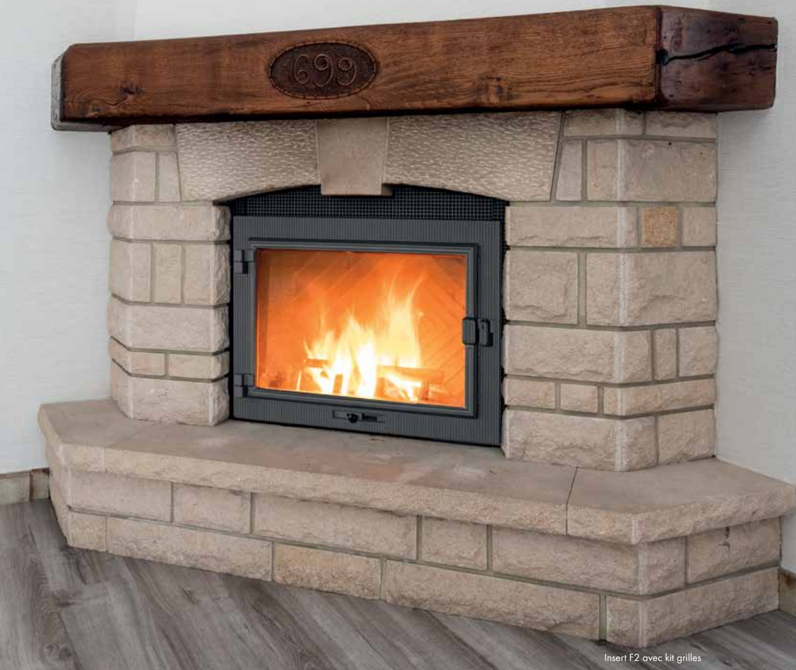
Insert F2 avec kit grilles