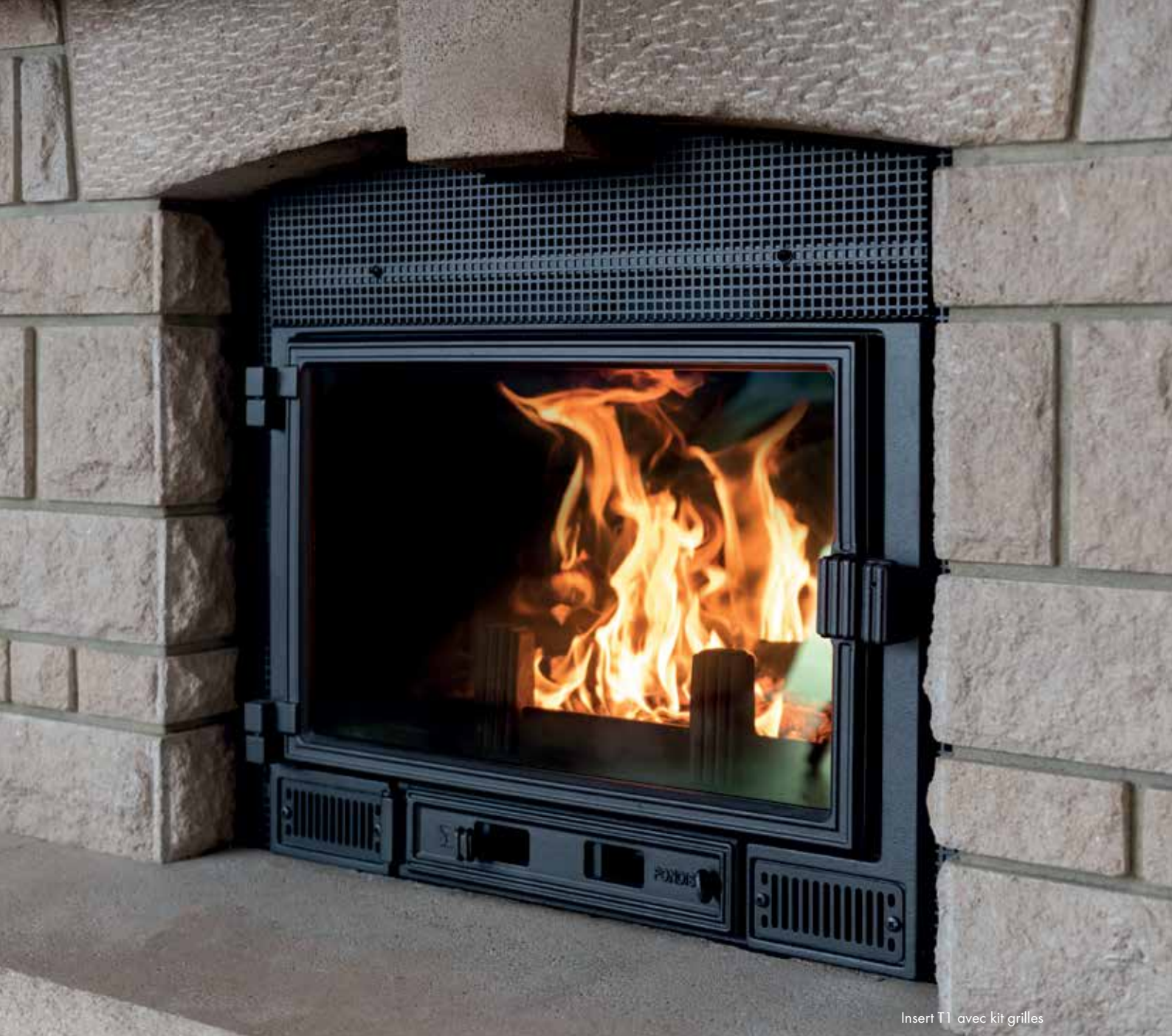
Insert T1 avec kit grilles