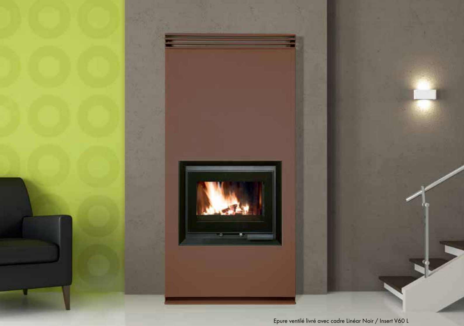
Epure ventilé livré avec cadre Linéar Noir / Insert V60 L