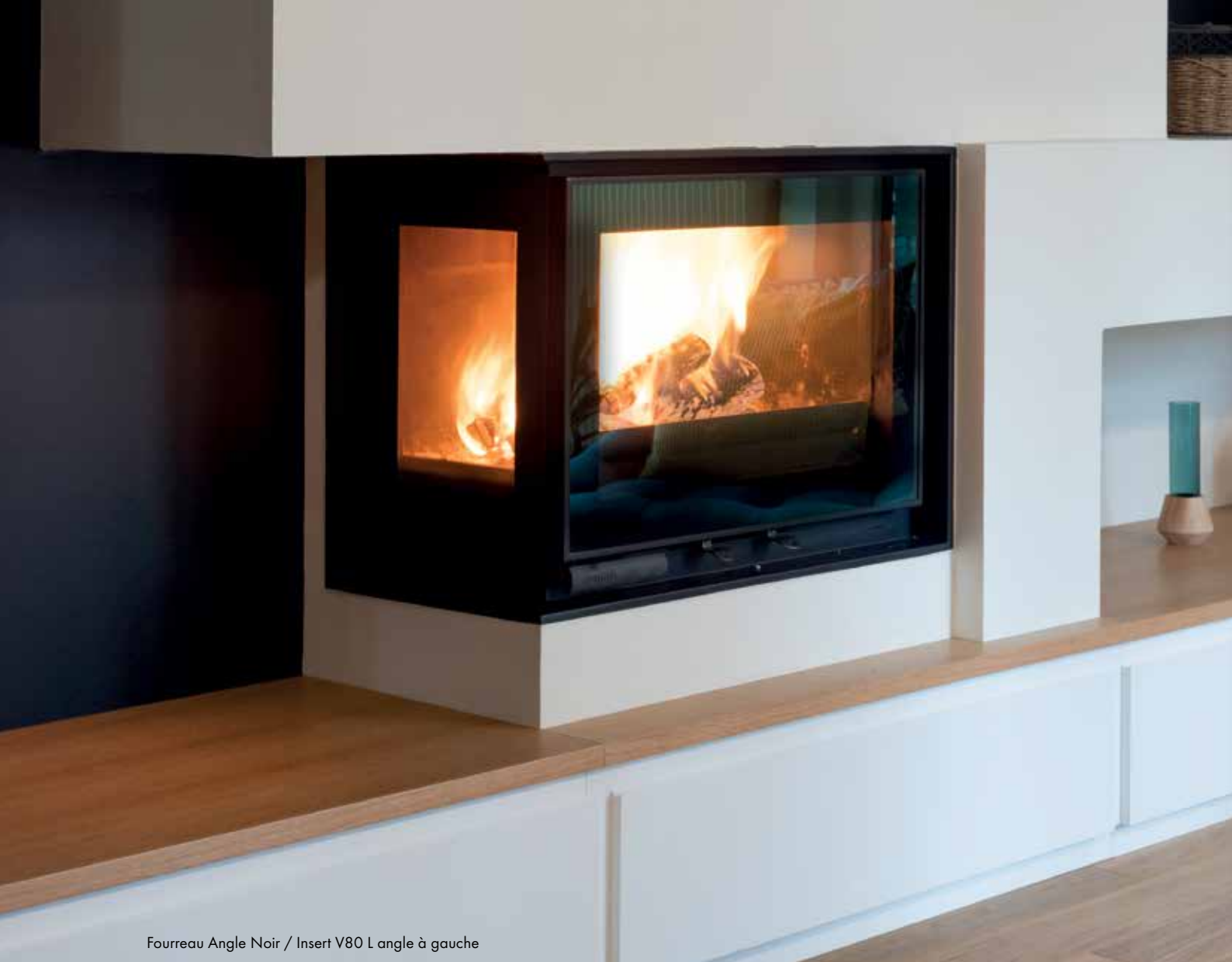
Fourreau Angle Noir / Insert V80 L angle à gauche