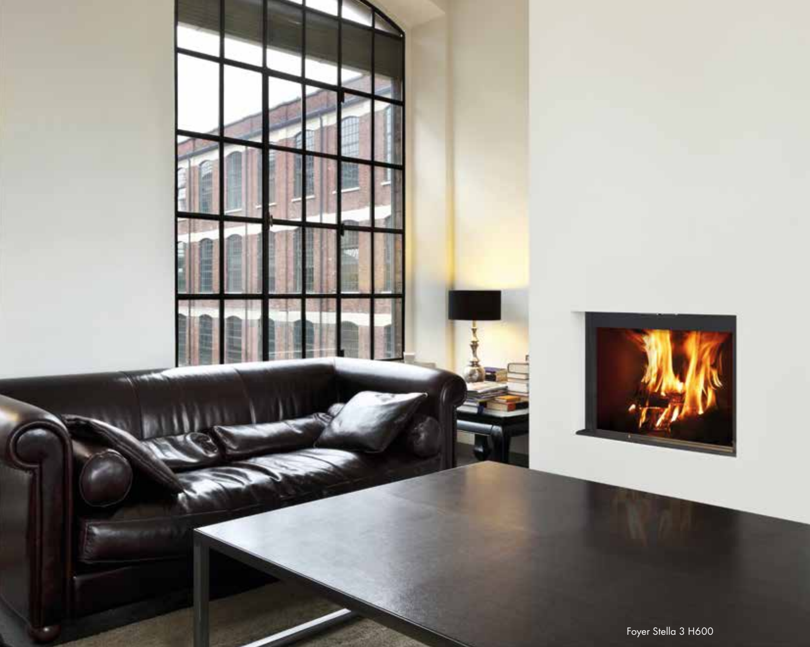
Foyer Stella 3 H600