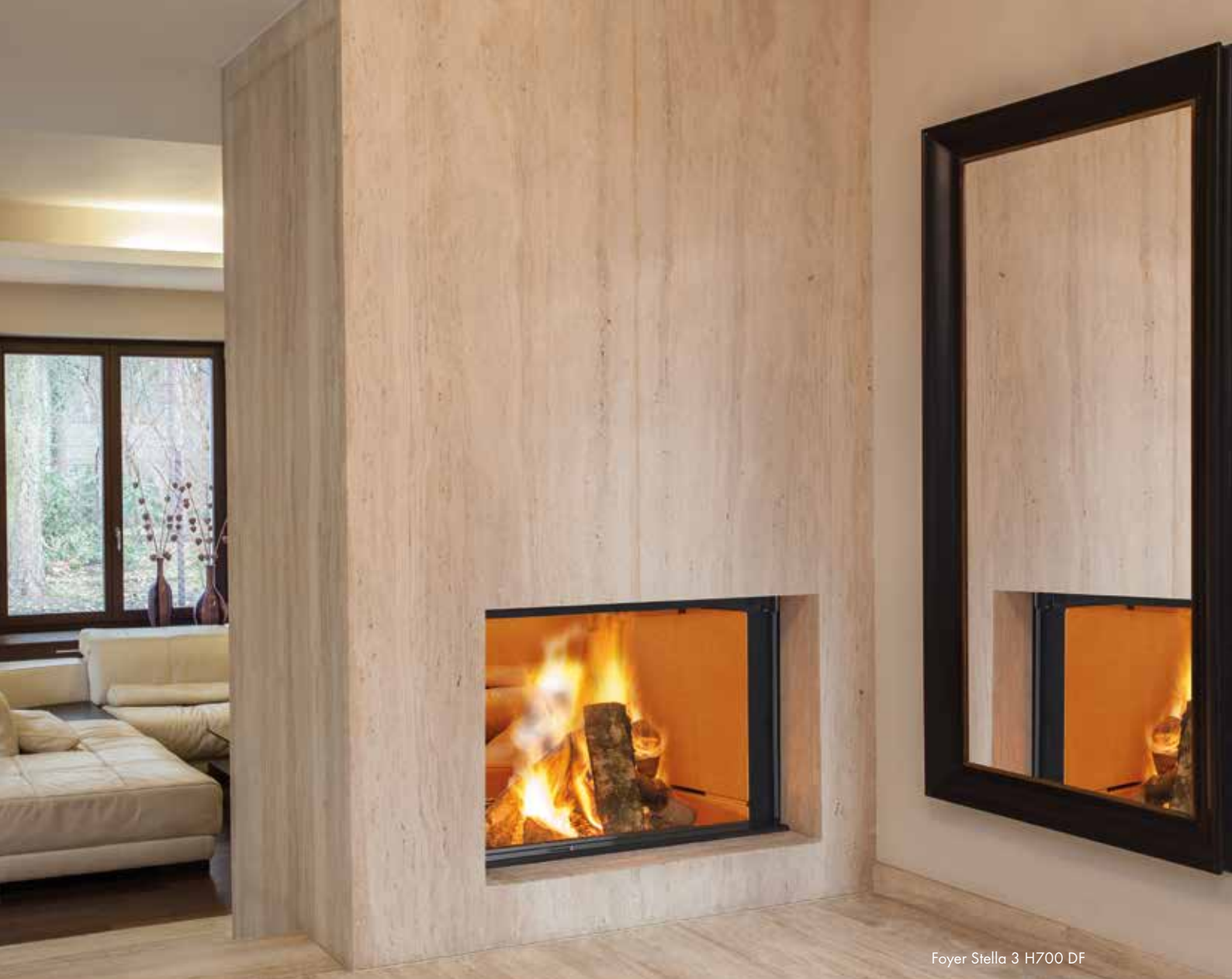
Foyer Stella 3 H700 DF