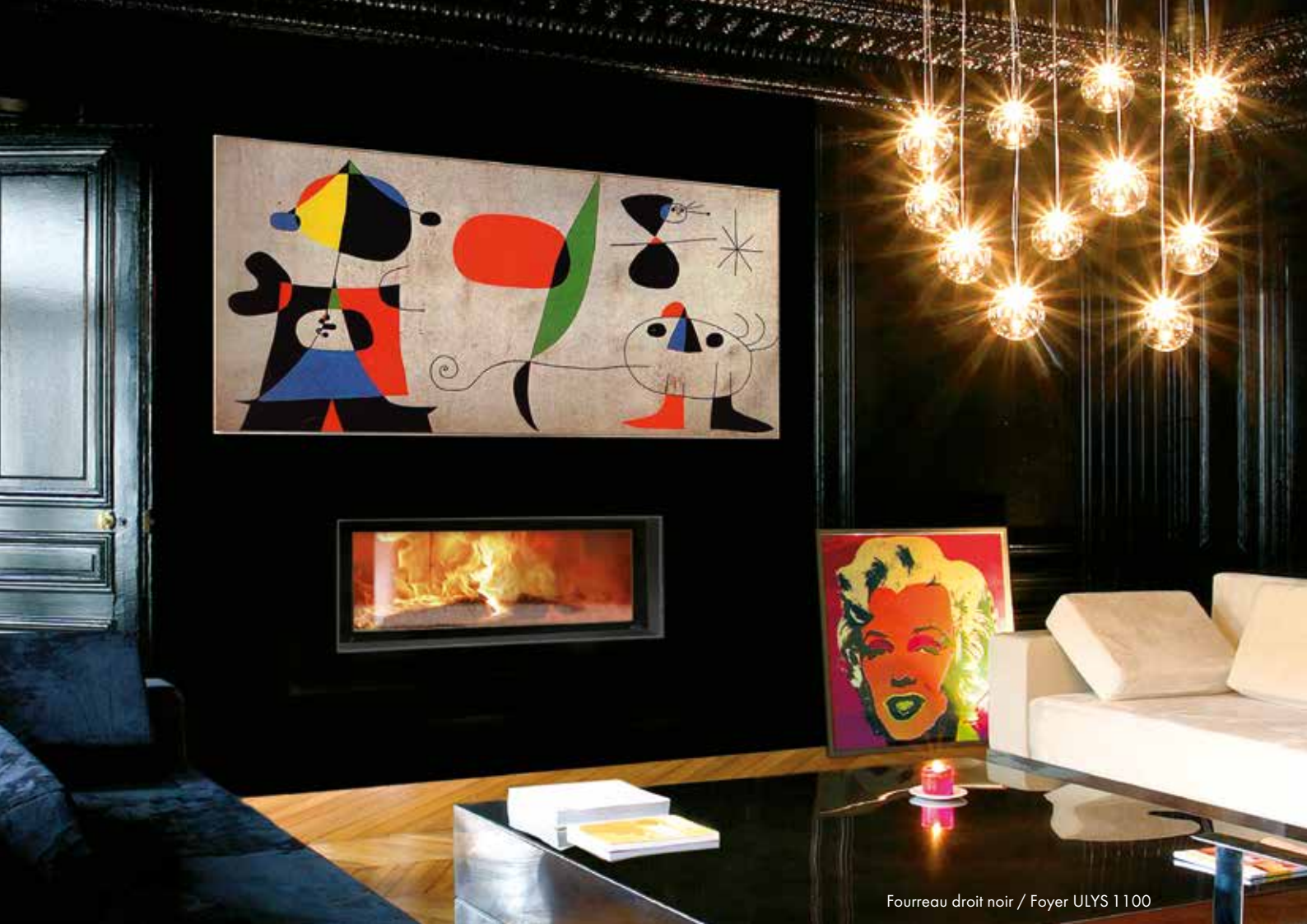
Fourreau droit noir / Foyer ULYS 1100