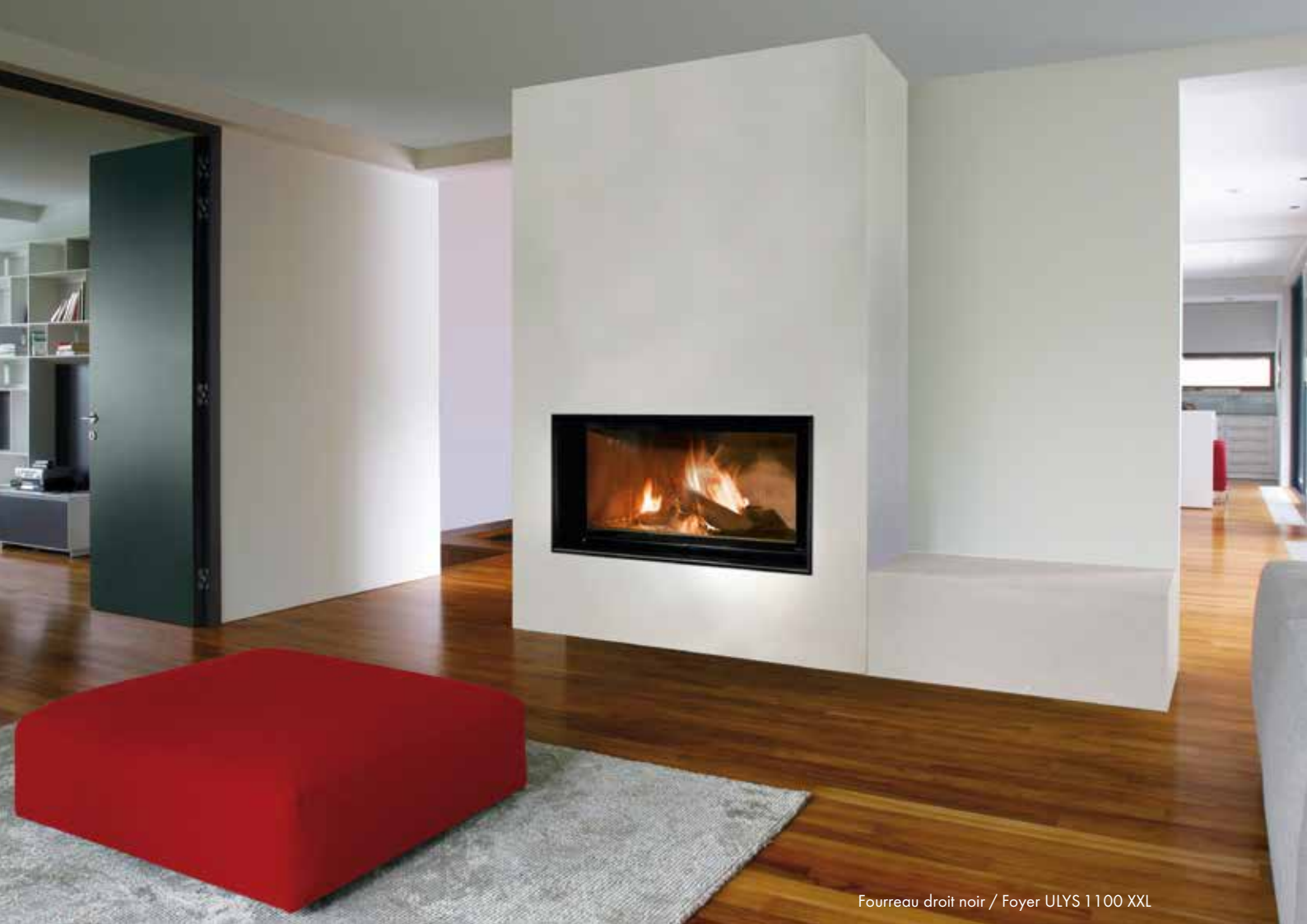
Fourreau droit noir / Foyer ULYS 1100 XXL