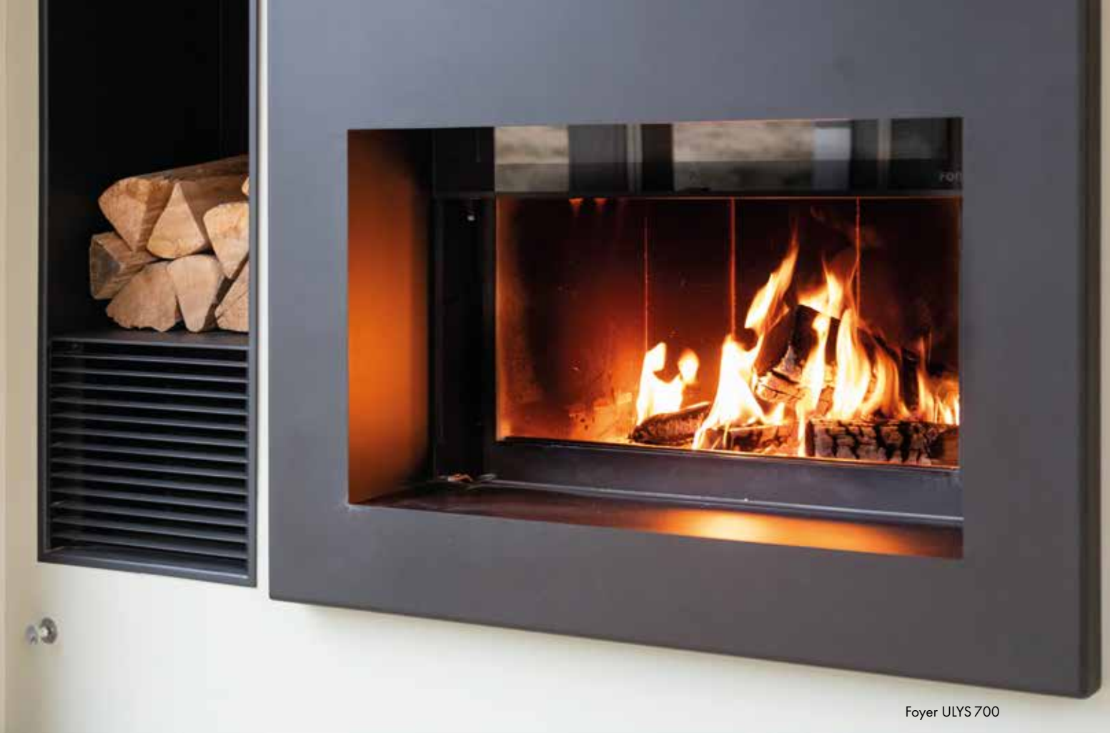
Foyer ULYS 700