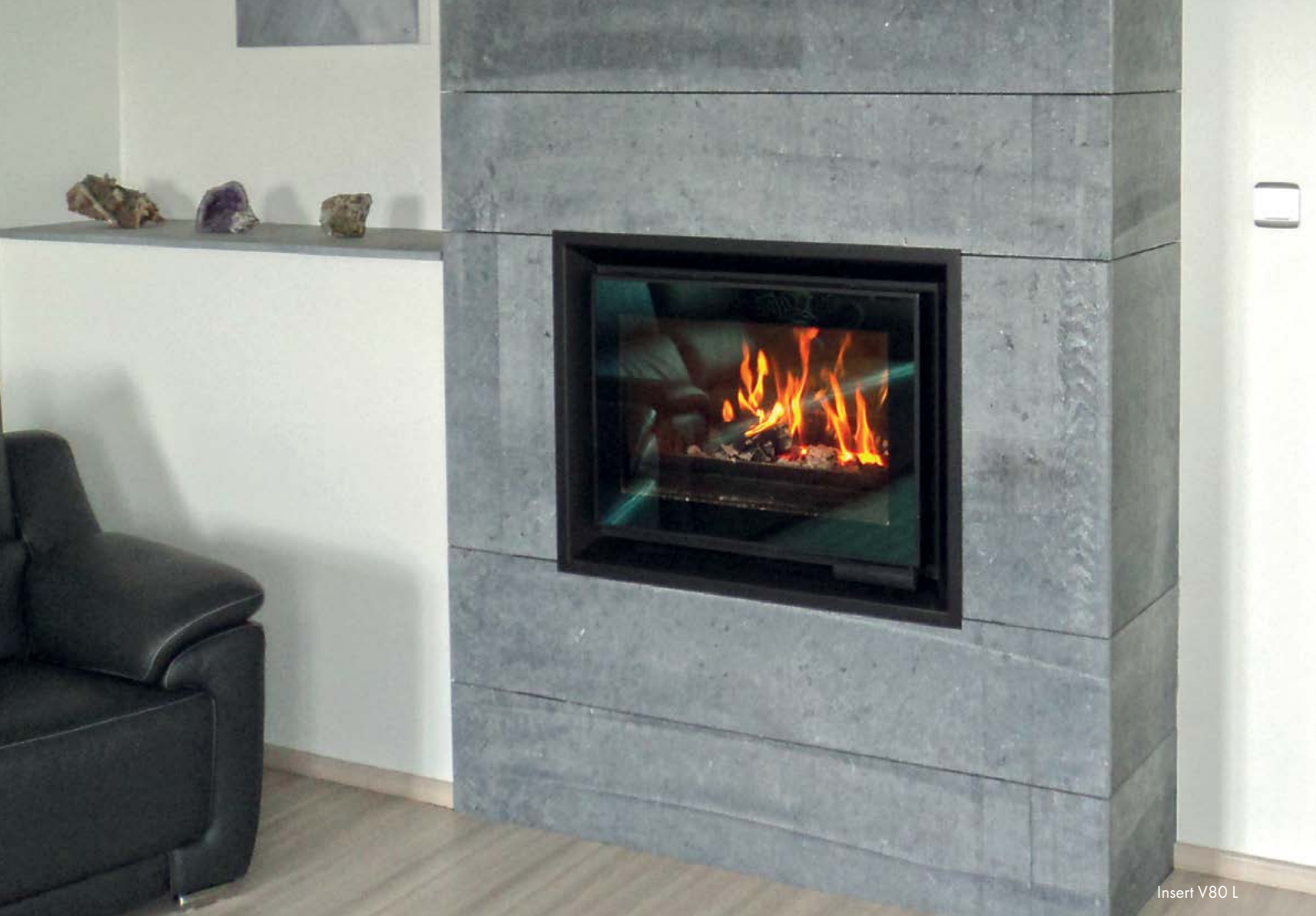
Insert V80 L