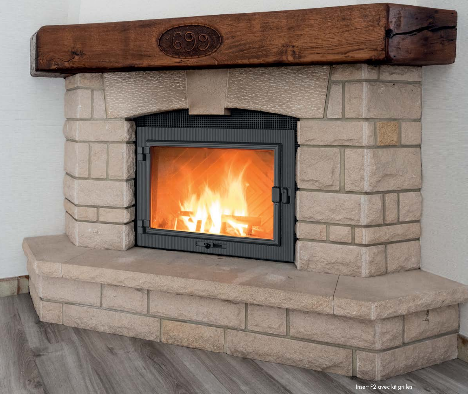
Insert F2 avec kit grilles