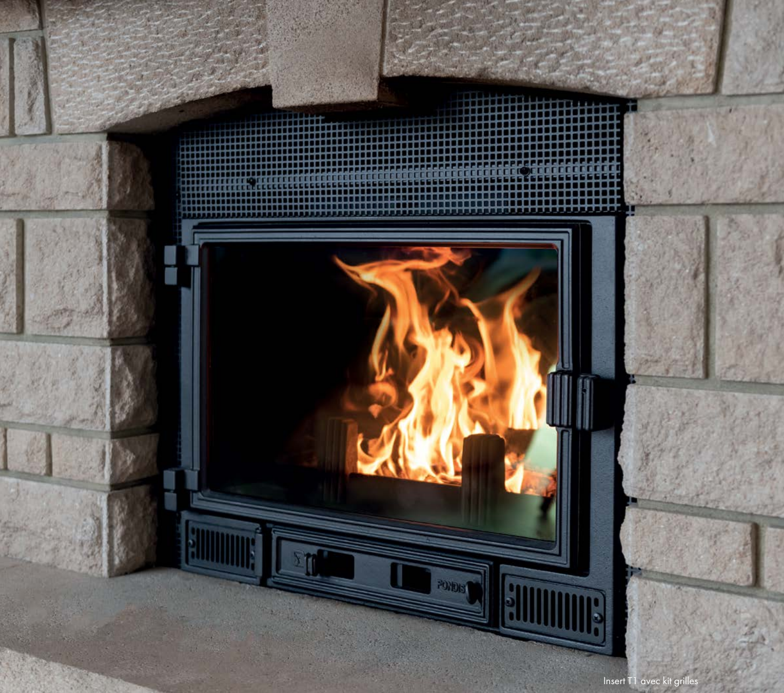
Insert T1 avec kit grilles