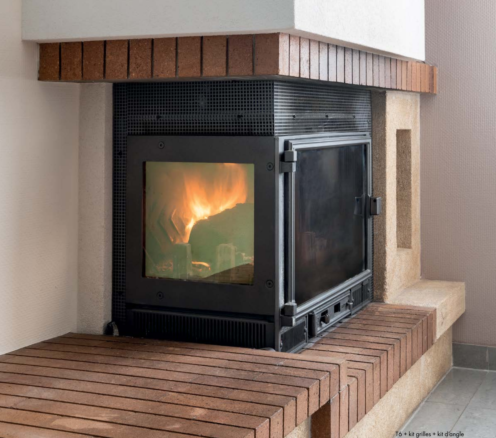
T6 + kit grilles + kit d'angle