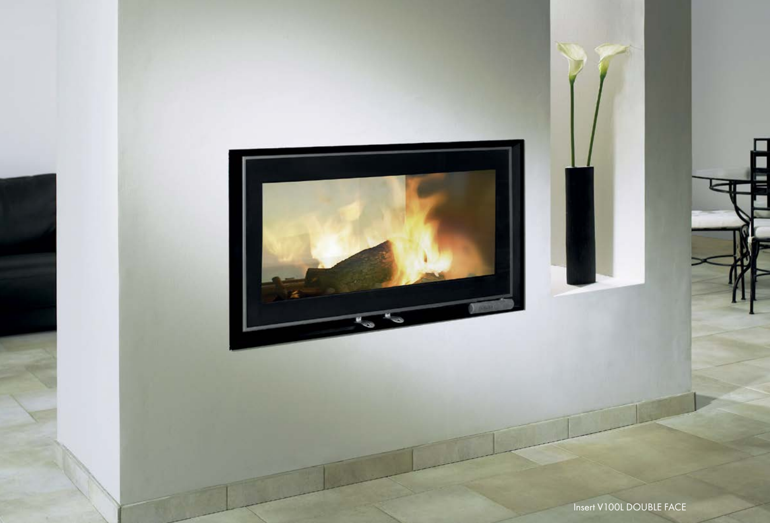
Insert V100L DOUBLE FACE