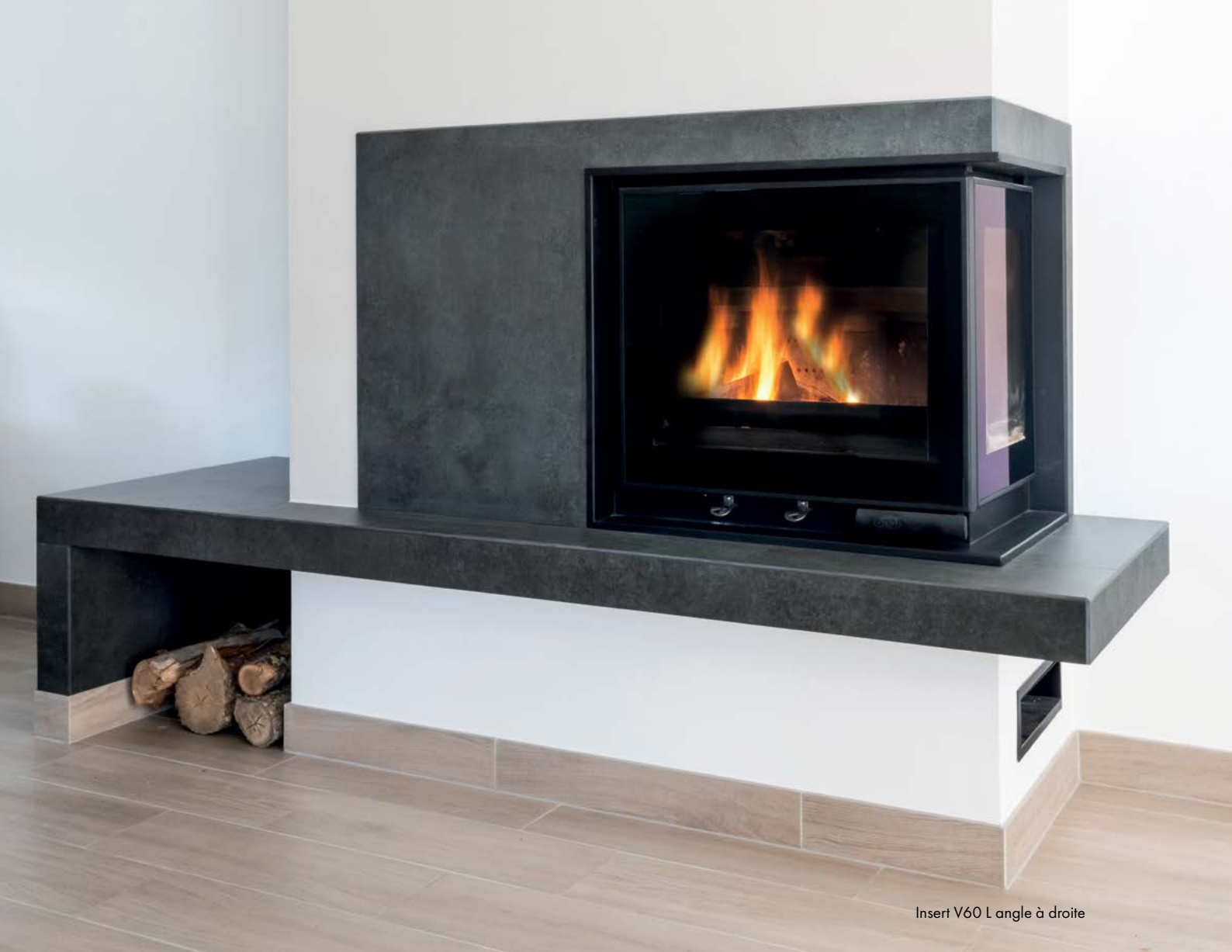
Insert V60 L angle à droite