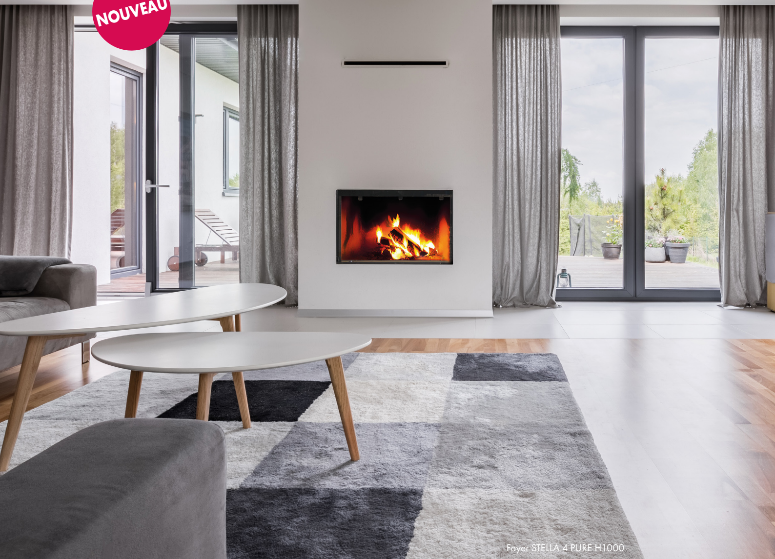
Foyer STÉLLA 4 PURE H1000