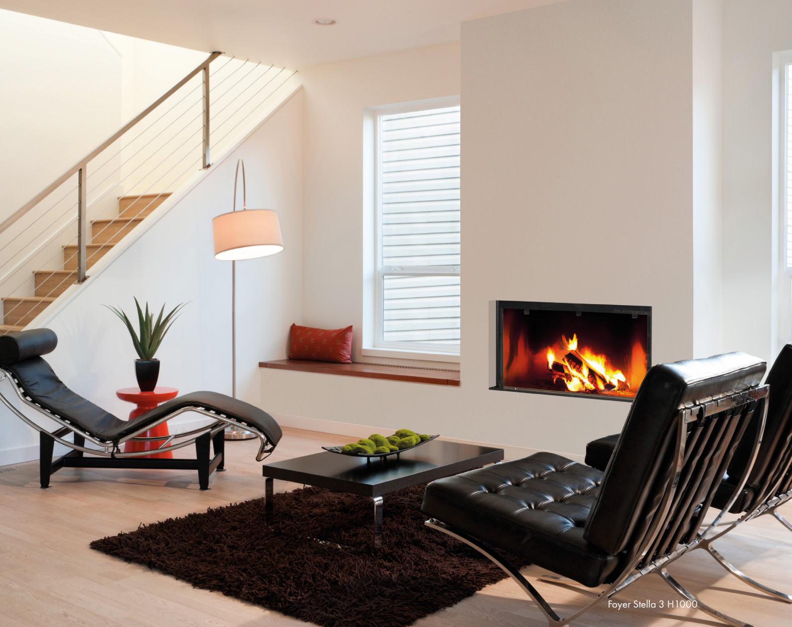
Foyer Stella 3 H1000