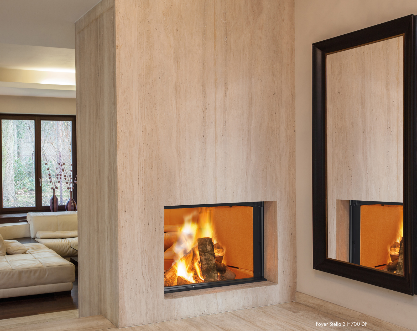
Foyer Stella 3 H700 DF