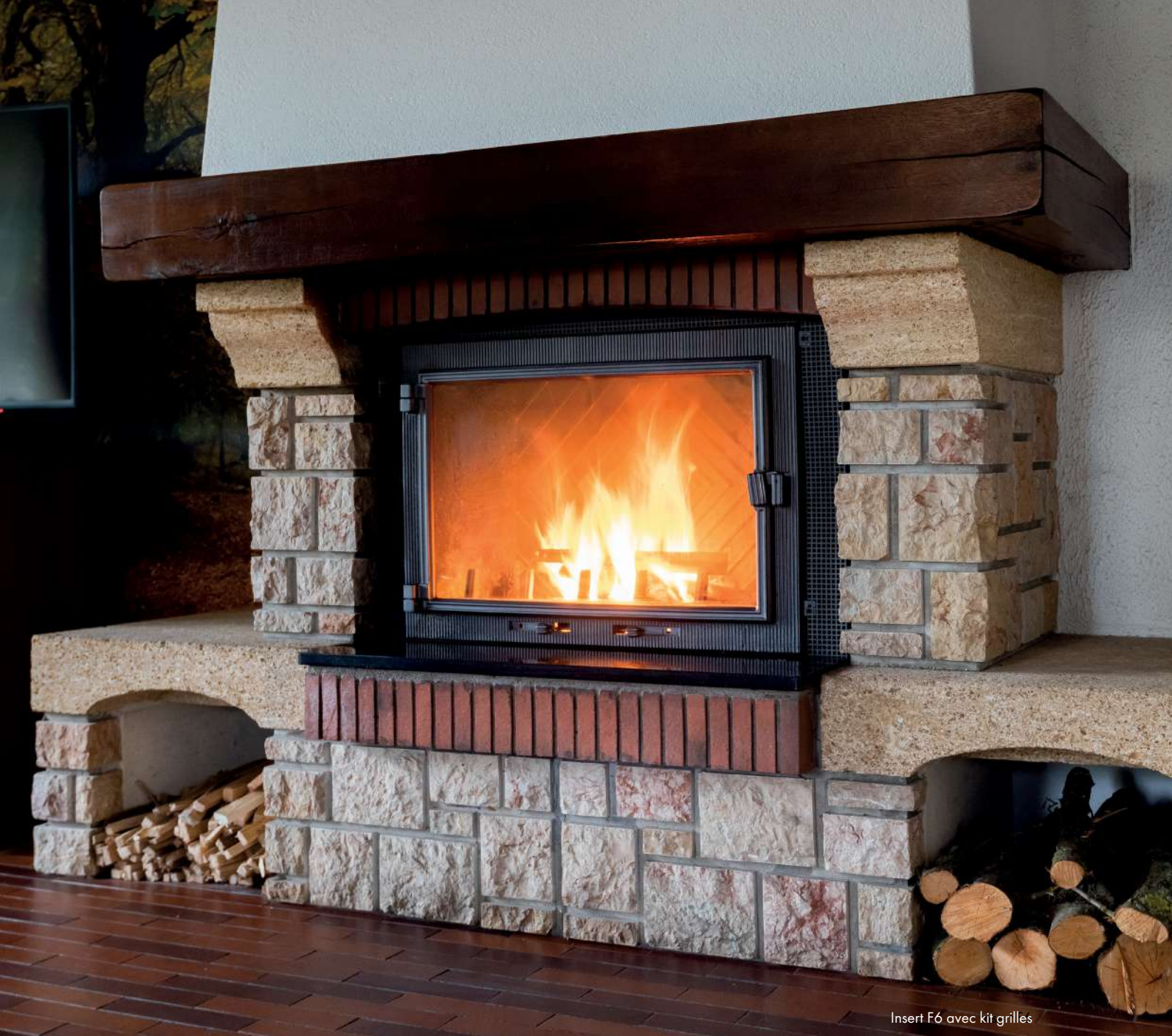
Insert F6 avec kit grilles