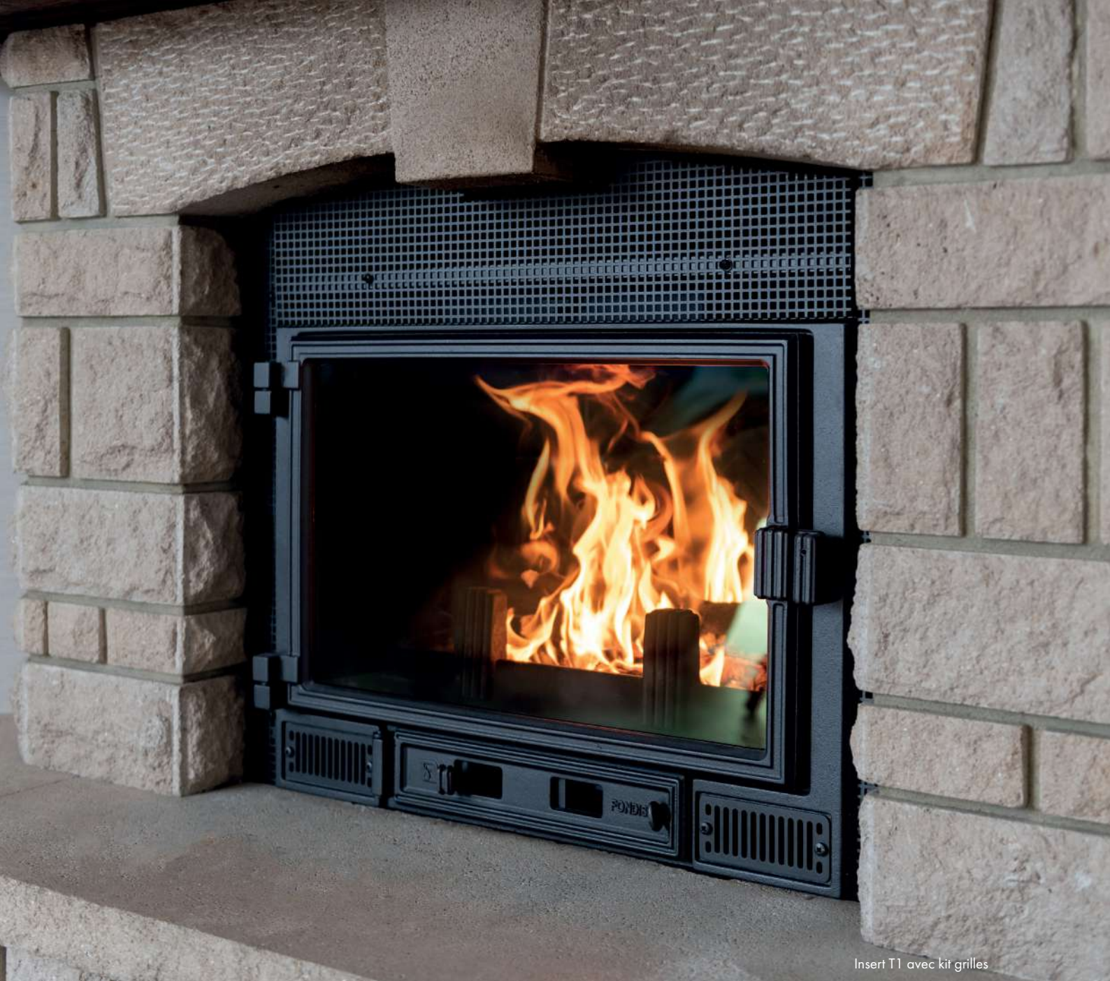
Insert T1 avec kit grilles