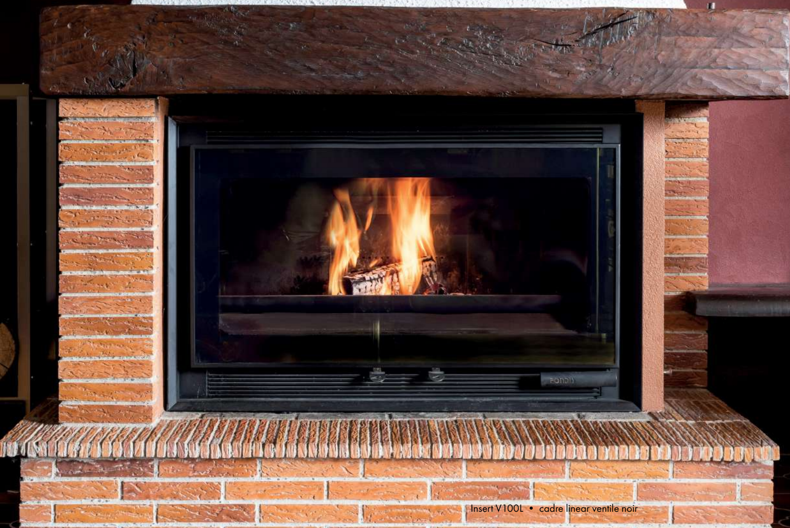
Insert V100L • cadre linear ventile noir