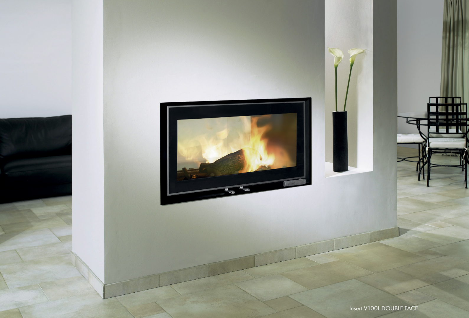
Insert V100L DOUBLE FACE