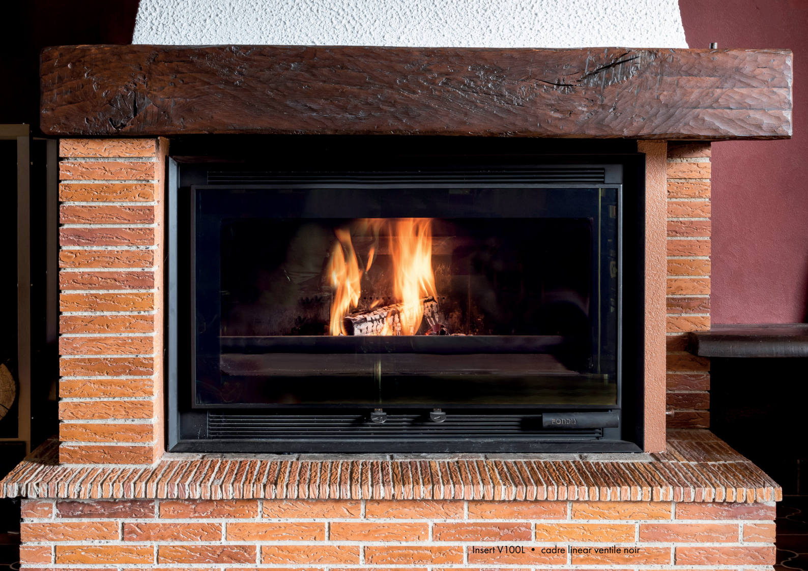
Insert V100L • cadre linéar ventile noir